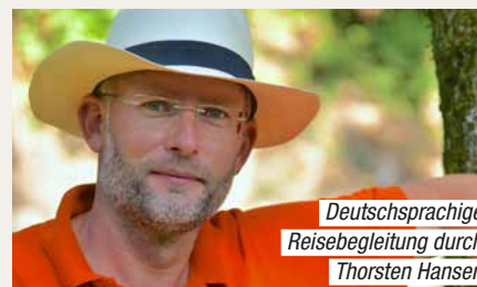
Deutschsprachige Reisebegleitung durch Thorsten Hansen